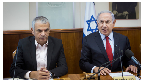
Finansminister Moshe Kahlon med premiärminister Netanvahu

Trots krav från Finansdepartementet att gå försiktigt fram vad gäller medel för utbildning så bestämdes det att den skulle höjas med 4,7 miljarder shekel (över 10 miljarder SEK) jämfört med förslaget på 2 miljarder och därmed landade budget på 57 miljarder shekel för 2017. Budgeten måste nu godkännas av Knesset. Ynet News 12 augusti